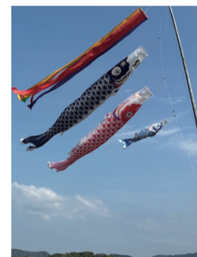
のびのび泳ぐ鯉のぼりに「気持ちよさそう!」と思っていましたが、困難の中で力強く美しく泳ぐ姿に、大切な教えを感じます。

ちょうどこの時期には青空を悠々と泳ぐ鯉のぼりを目にしますが、鯉のぼりを揚げるのは、江戸時代、男の子が生まれた印として幟（のぼり）を立てた武家をまね、粋な町人たちが和紙で作った鯉の幟を揚げたのが始まりだそうです。鯉は立身出世のシンボルで、鯉が滝を昇って竜になったという「登竜門」伝説に由来し、登竜門に向かった勇ましい鯉たちのように、鯉のぼりには「困難に揉まれながらも打ち勝って、将来大成しますように」という願いが込められているのだといえます。竜門を登ろうとたくさんの魚たちが挑戦し