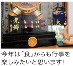
今年は「食」からも行事を楽しみたいと思います！

年度末、進級を控えた息子が「もうすぐパンダさんなんだ〜」（3歳児クラスに進級する意味）と嬉しそうに話していました。週に一度体操服での登園になることや、年上のお兄さん・お姉さんと一緒にお昼ご飯を食べることなど、少しずつ新しい生活にも慣れてきてい