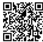
カグヤの理念ブックも博進堂様のお陰様で、内容の一部を出版させていただきました。

これは、人が人を育てるといふ考え方だけに頼るのではなく、環境を通して人が育っていく仕組みをつくるうといふ試みでもあります。そしてこれは、子ども主体の保育の中にいる子どもたちそのものです。子どもたちは、子ども同士で学び合い、成長し合います。また、ゾーンやコーナーといった環境の中で主体的に育っていきます。