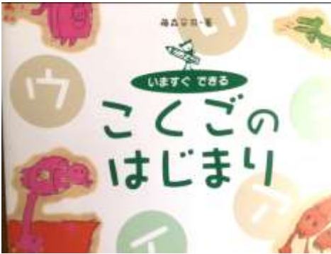
保育者のためのはじまりシリーズ 学習研究社 (2001/2/15) 藤森平司 著