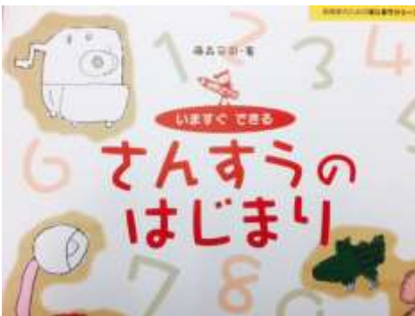
保育者のためのはじまりシリーズ