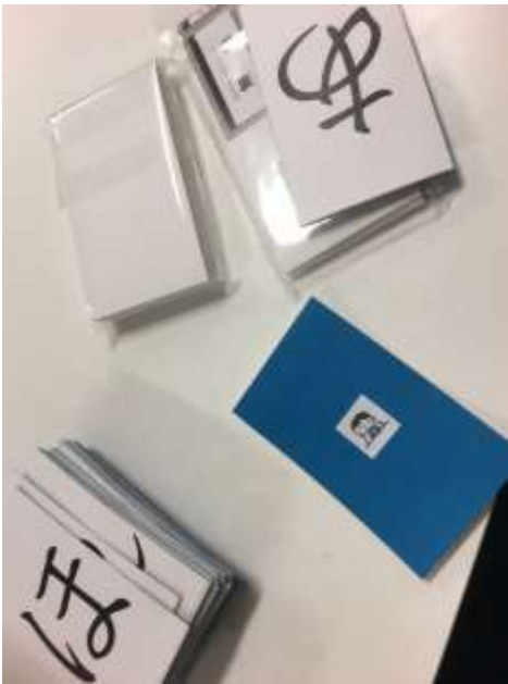
あいうえおトランプ 遊び方事例