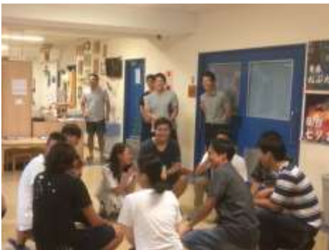
猛獣がりに行こうよ！人数揃って着席