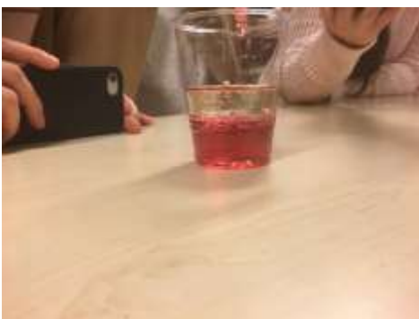
科学実験：色が変わるハーブティー