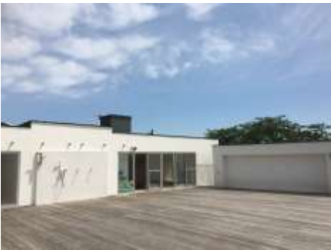
ふかさわミル保育園