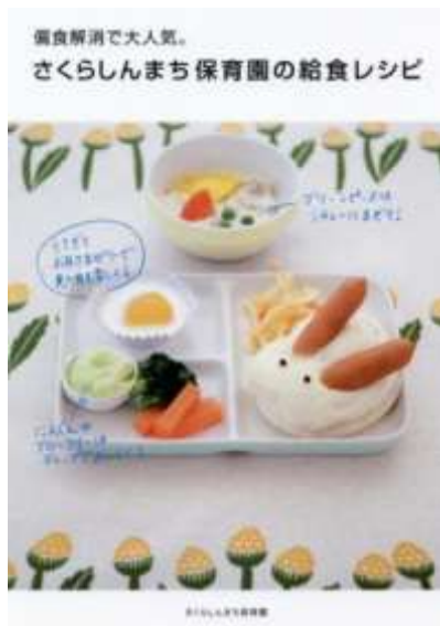
さくらしんまち保育園【著】 メディアファクトリー (2011/07)