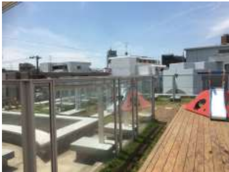
さくらしんまち保育園