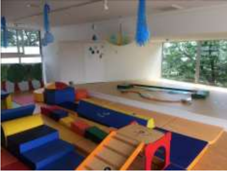
ふかさわミル保育園