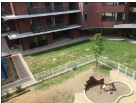
ふかさわミル保育園