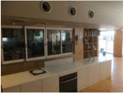
さくらしんまち保育園