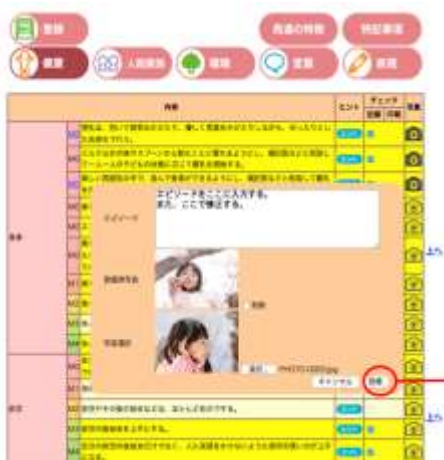
開発中の画面： 新指針に沿ってソフトも Ver.up !