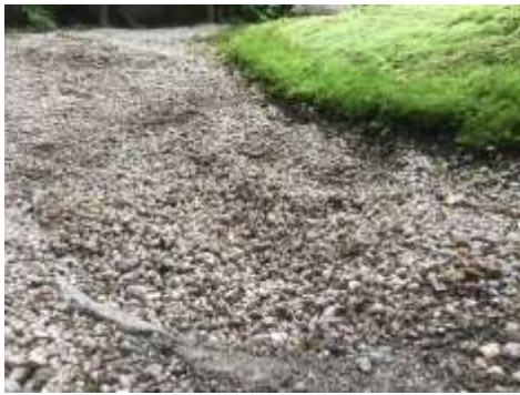
うっすら井戸が埋められた跡