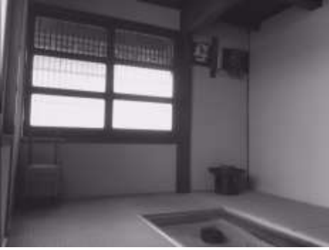
七島畳を敷き詰めた部屋