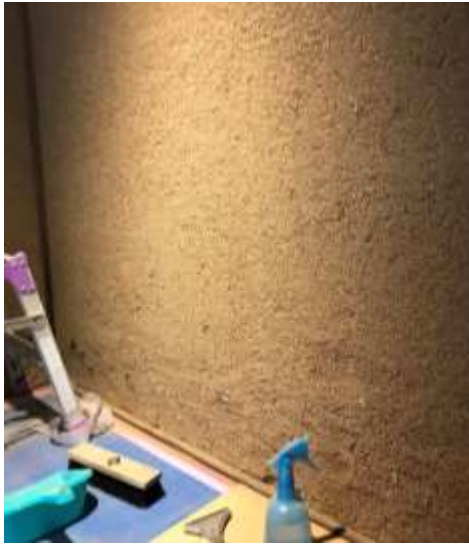
表面の塗装を剥ぐと土壁が！