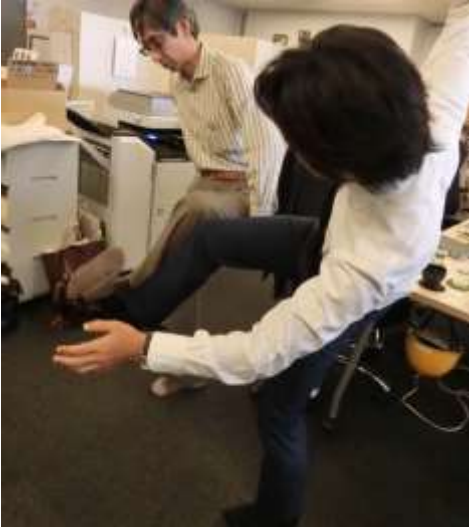
迷作アクティビティ②