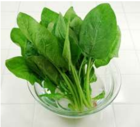
「協力-個人」領域 ほうれん草ゲーム