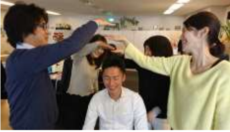
迷作アクティビティ①