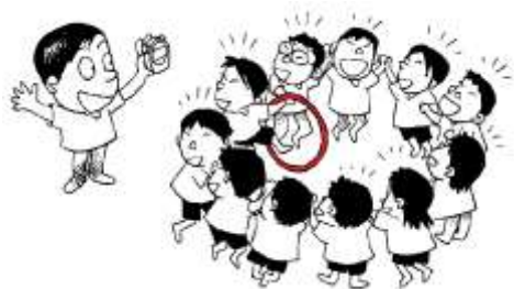
「競争-チーム」領域 フープリレー