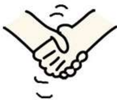
「競争-個人」領域 ソウルハンド