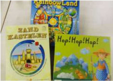
「協力-チーム」領域 アースゲーム